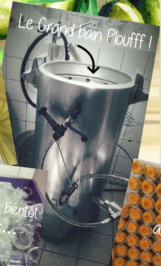
Le Grand bain Ploufff!