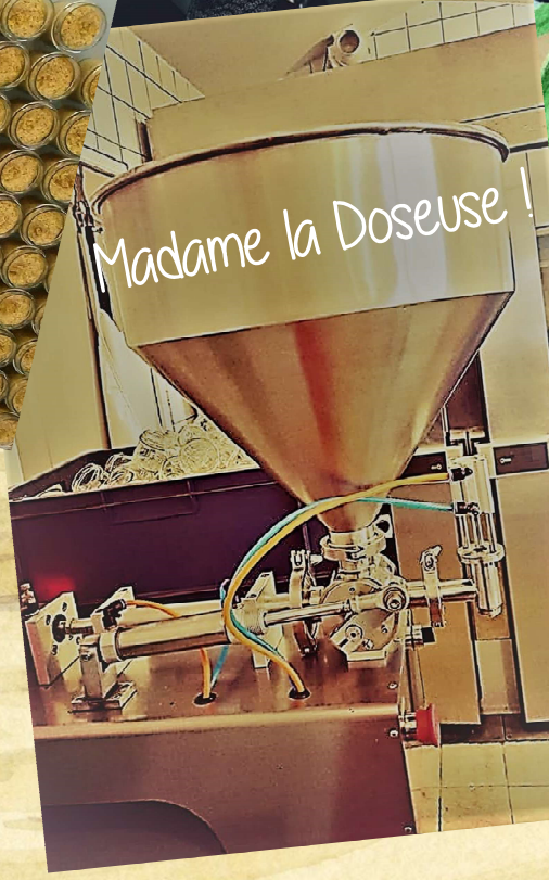
Madame la Doseuse!