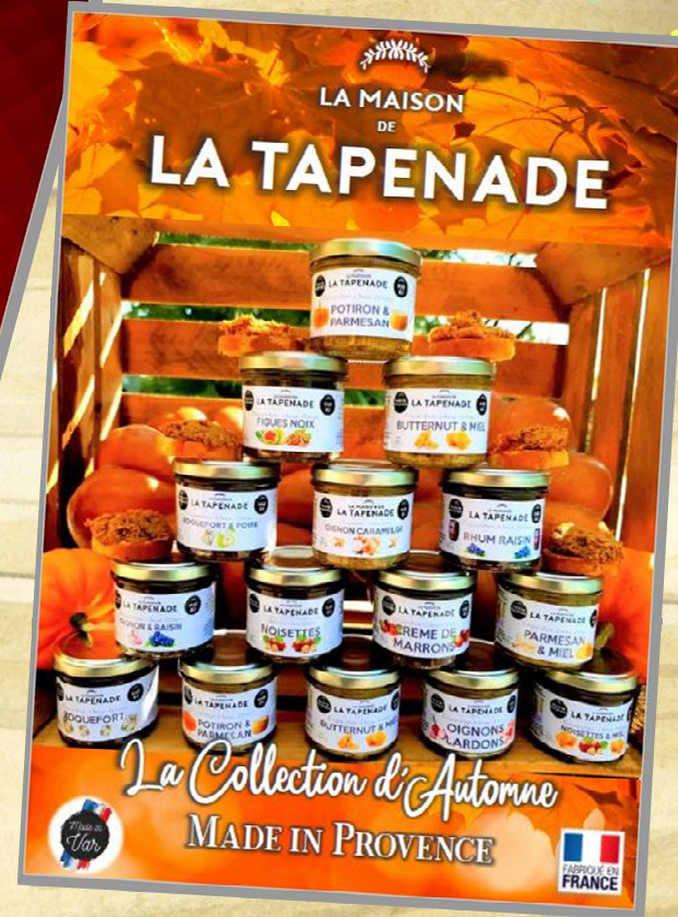
AFFICHES A3 COLLECTION AUTOMNE