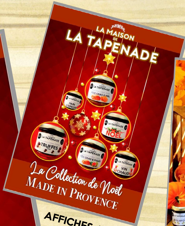
AFFICHES A3 NOEL