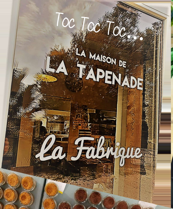
Toc Toc Toc... LA MAISON DE LA TAPENADE La Fabrique