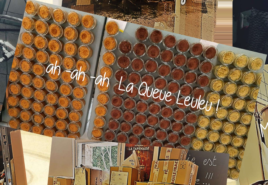
ah-ah-ah La Queue Leuleu!