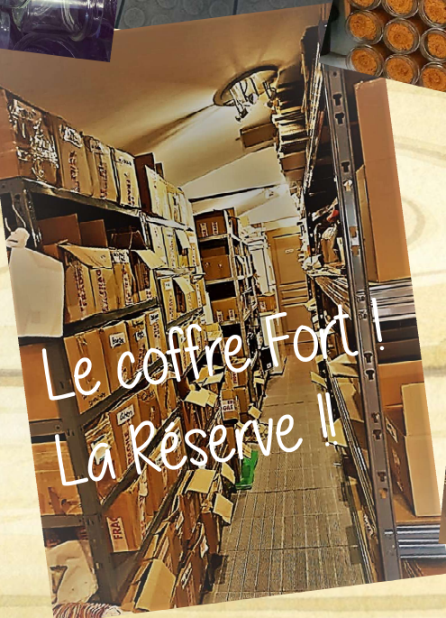
Le coffre Fort La Réserve !!