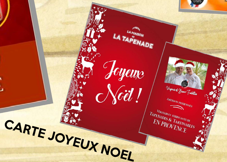
CARTE JOYEUX NOEL