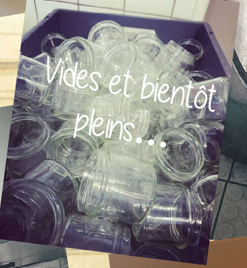
Vides et bientôt pleins...