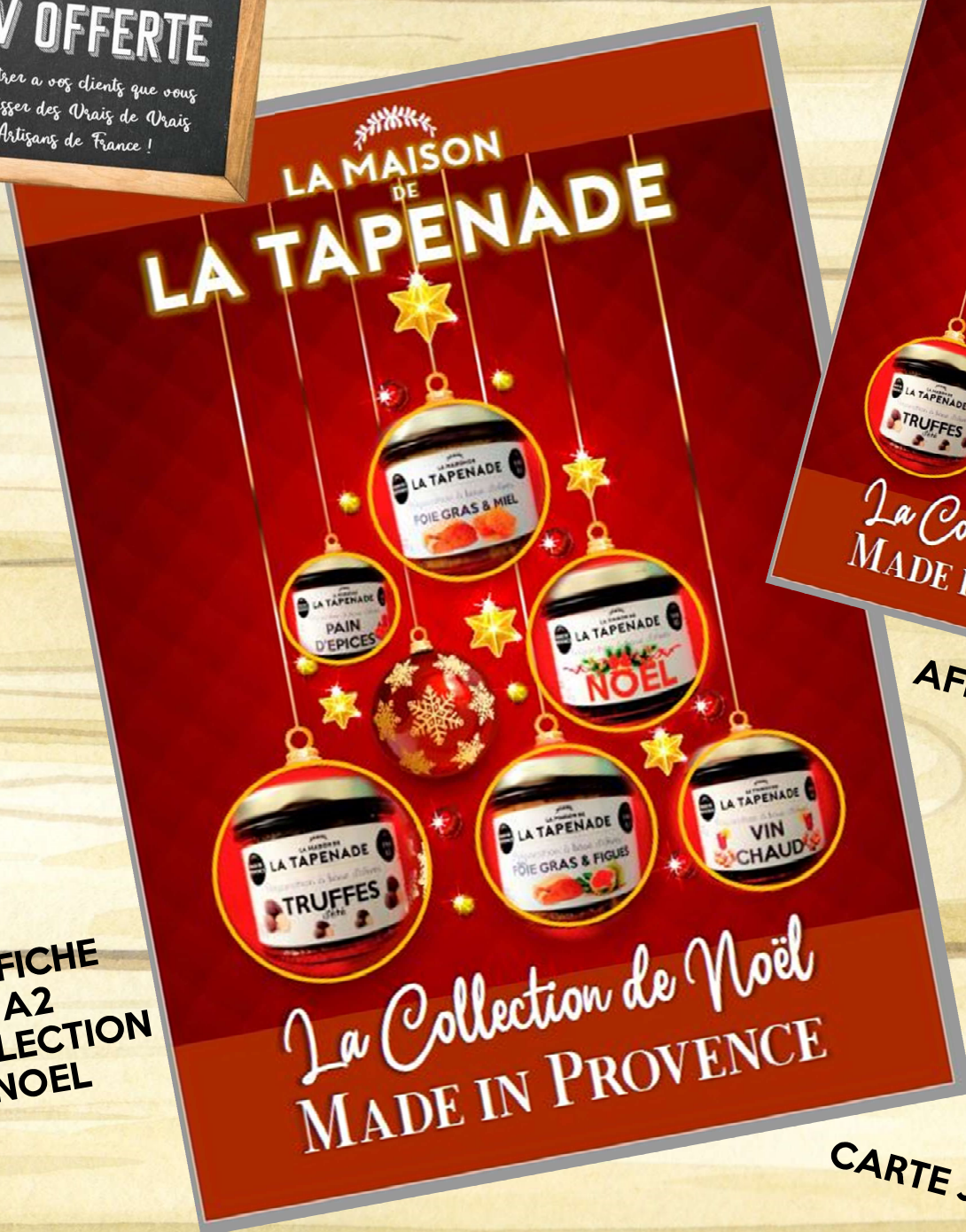
AFFICHE A2 COLLECTION NOEL

LA MAISON DE LA TAPENADE PLV OFFERTE Montrer à vos clients que vous choisissez des Vrais de Vrais Artisans de France !