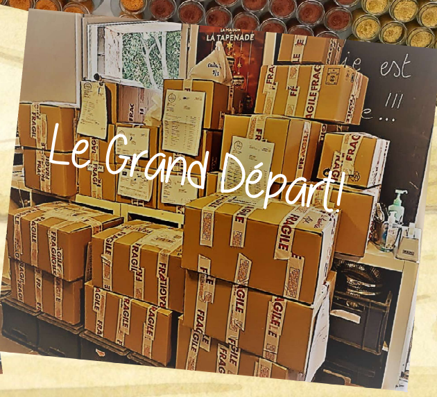
Le Grand Départ!